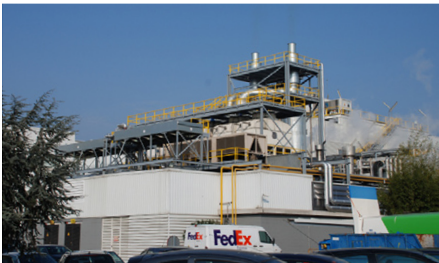
Nueva instalación de cogeneración de 6,1 Mw de potencia. Parets del Vallés, Barcelona.

La división Bioscience ha incrementado su producción un 25%, mientras que el incremento del consumo de energía eléctrica y agua ha sido del 4% y 13% respectivamente.