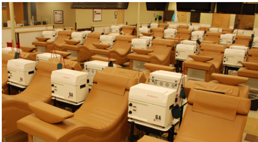
Centro de plasmaféresis de Glendale, Arizona USA, puesto en servicio en dic. 2008

La estrategia emprendida hace años por Grifols de contar con una integración vertical de negocio responde a un doble objetivo: controlar el coste y disponer de plasma con los máximos niveles de seguridad y calidad. Actualmente, el volumen de plasma que obtiene Grifols de sus propios centros cubre prácticamente la totalidad (98%) de las necesidades de fraccionamiento del grupo, que van incrementando en la misma proporción que el plasma obtenido y se traduce en más producto acabado para dar respuesta a la demanda del mercado.