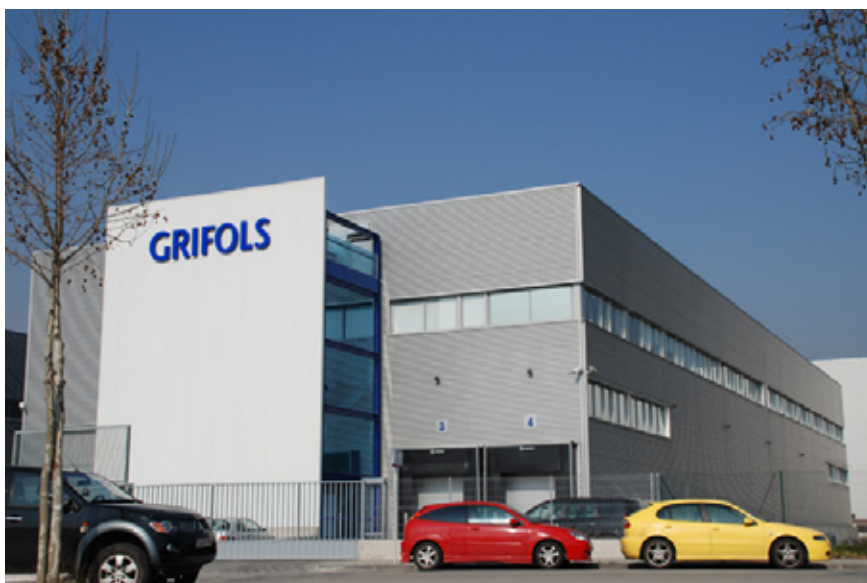
Nueva sede del Área Técnica y de I+D de la División Hospital. Parets del Vallés, Barcelona.

Inversiones en la planta de Los Ángeles destinadas a ampliaciones, mejoras y maquinaria específica.